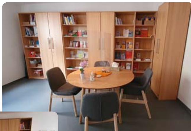
Die neuen Beratungsräume