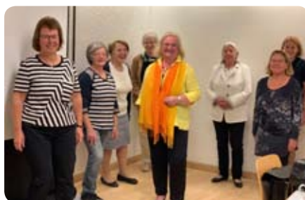
Der alte und der neue Vorstand

donum vitae Regionalverband Gießen e.V. Schwangerschaftsberatungsstelle anerkannt nach §§ 218/219 StGB